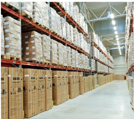
Distributiecentra en opslag